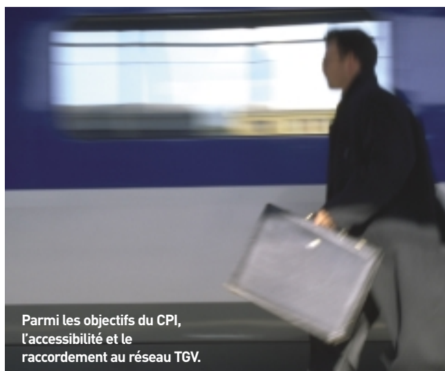
Parmi les objectifs du CPI, l'accessibilité et le raccordement au réseau TGV.

Un groupe d'experts indépendants, présidé par Jean-Paul Lacaze, a réalisé une évaluation de ce contrat prototype. Ses conclusions soulignent l'intérêt des partenaires qui souhaitent pérenniser le dispositif mais également la complexité des procédures qu'il fallait adapter. Un bilan financier sera publié au cours du dernier semestre de l'année 2002. Il sera transmis aux Conseils régionaux concernés.