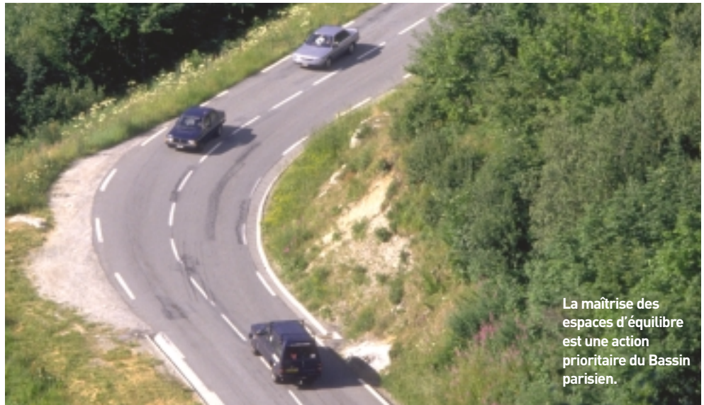
La maîtrise des espaces d'équilibre est une action prioritaire du Bassin parisien.